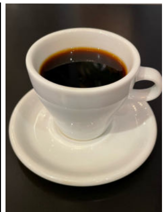
Set drink +150yen