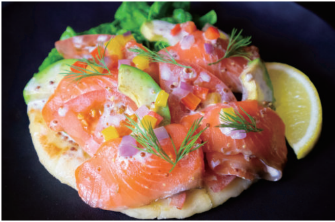
サーモンとアボガド半熟玉子のサラダピタパン Salmon and avocado soft-boiled egg salad pita bread 特製ハニーマスタードソース使用 1,100yen