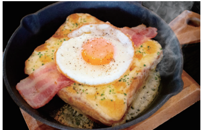
クロックムッシュ Croque monsieur 750yen 鉄板で熱々を提供