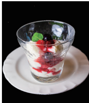
Set mini dessert +200yen