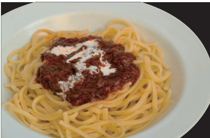
ミートソースパスタ Meat sauce pasta 1,100yen