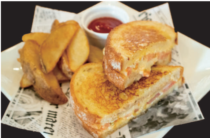
ツナトマトチーズのホットサンド Tuna tomato cheese hot sandwich 750yen 粒粉カンパニーを使用し、表面カリカリに仕上げました